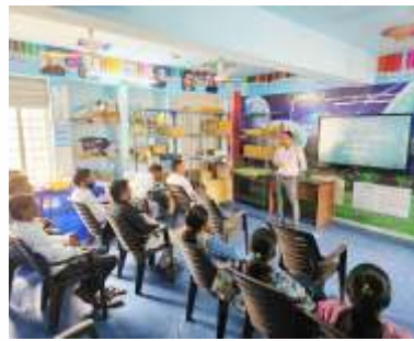
सत्र १: लातूर एका वळणावर: जिल्हास्तरीय विषमता आणि विकासातील तफावत