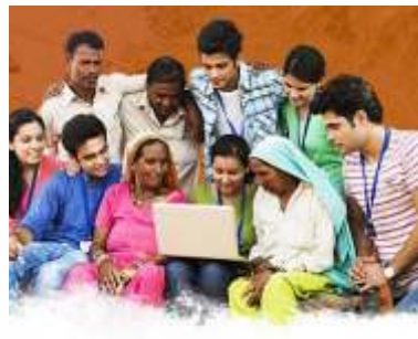
सत्र ४: बदलाचे प्रवर्तक म्हणून युवा - नेतृत्व, नवोपक्रम आणि सहभाग