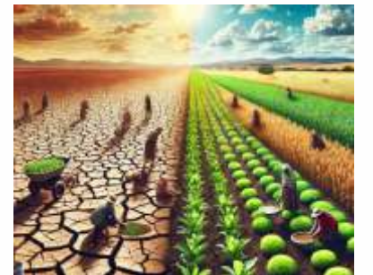
सत्र ५: संतुलित विकासासाठी धोरणे: महाराष्ट्रातील अंतर्गत प्रादेशिक तफावत कमी करण्याचे मार्ग