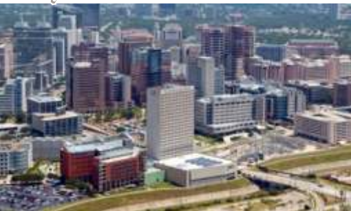
सत्र ३: शहरी महाराष्ट्र: असमतोल वाढ आणि उदयोन्मुख विषमता