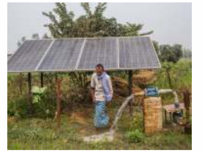
सत्र २: ग्रामीण महाराष्ट्र: गावांमधील अंतर्गत प्रादेशिक विषमता