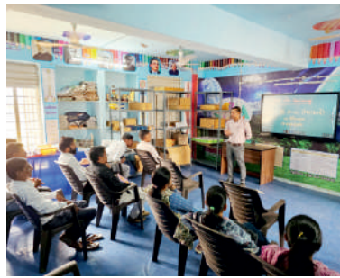
सत्र १: ग्रामीण महाराष्ट्र: धोरणांची अपयश की व्यवस्थेचा दोष?