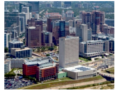
सत्र २: शहरी महाराष्ट्र: प्रगतीचा आभास की विषमतेची वास्तवता?