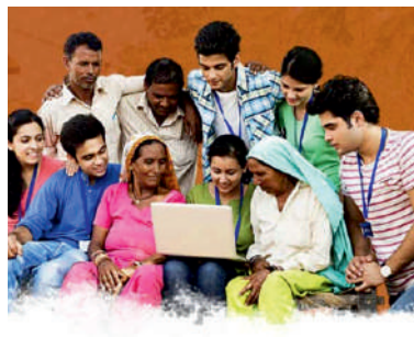
सत्र ४: स्थित्यंतर की क्रांती? : युवक केवळ भागीदार नाही तर तोच बदलाचा केंद्रबिंदू