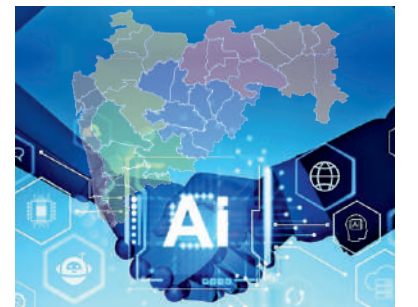
सत्र ५: वेगवान व प्रगतीशील शासन आणि प्रशासनासाठी AI चा वापर: नागरिक म्हणून आपण किती सज्ज?