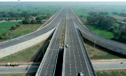
सत्र ३: लातूर पुनरावलोकन: शाश्वत विकासासाठी एक तुलनात्मक चिंतन